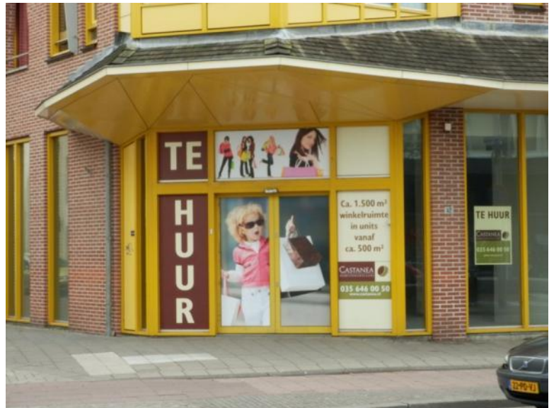
De bank ging dicht en het werd meer winkeloppevlak (Xenos) .....