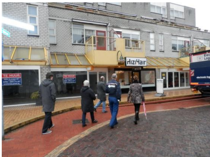
Helaas veel leegstand bij de Nieuwe Brink. Maar meer winkels werkt averechts tegen de leegstand!